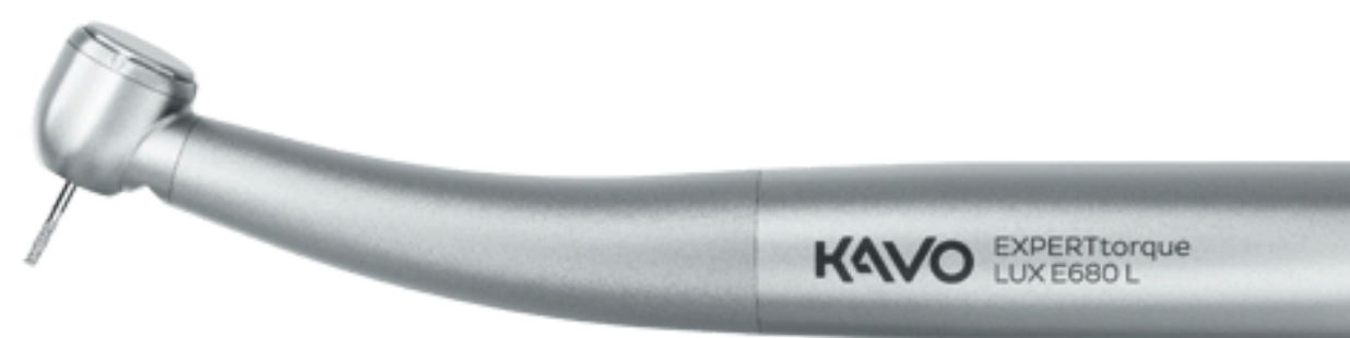
EXPERTtorque E680 L Turbine jetzt für je 620 €