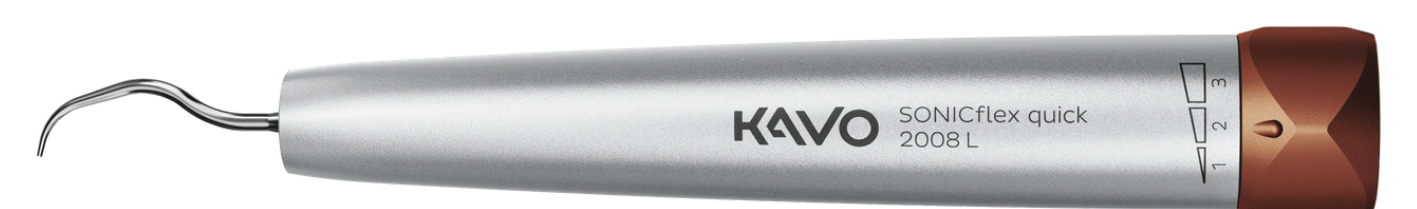
SONICflex Quick 2008 L Airscaler jetzt für je 1.227 €